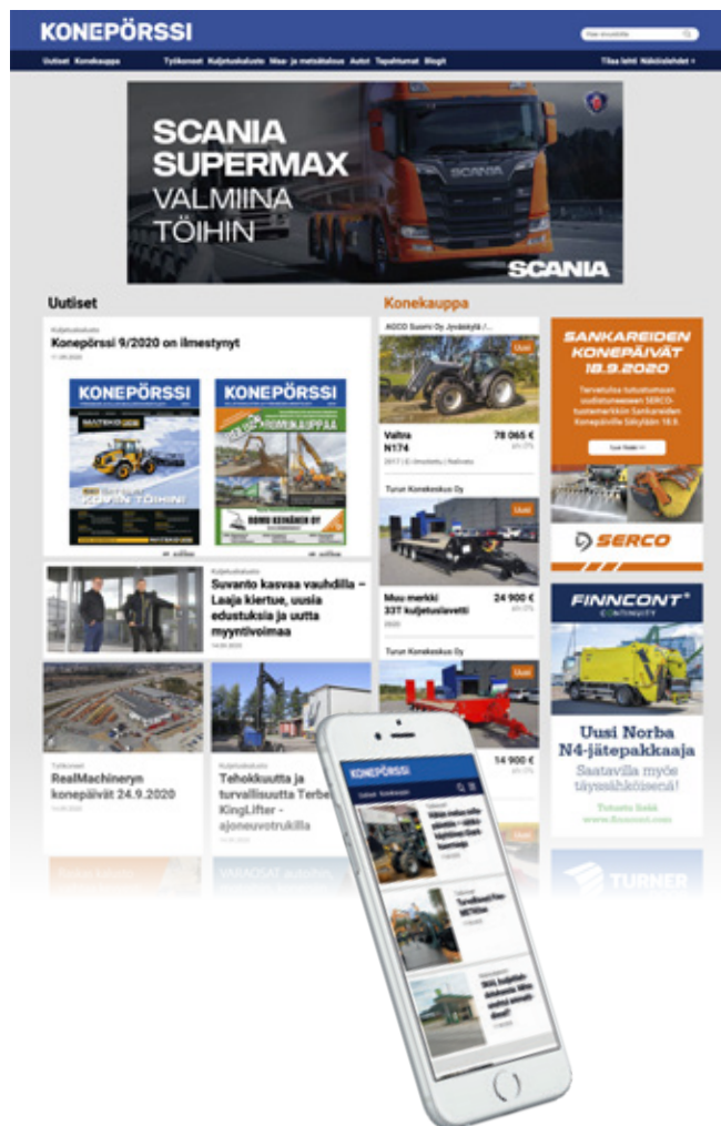
Mitat leveys x korkeus